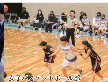
女子バスケットボール部