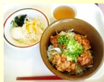
学食の人気メニューからあげ丼+サラダでなんと500円！！

山梨県出身の学生も多いですが、北は北海道、南は沖縄まで、全国各地から集まっています。大学周辺にはアパートがたくさんあり、一人暮らしをしている学生も多いです。なんとっても、家賃が安い！だいたい2~4万円くらい。お父さんお母さんは大喜びです。スーパーはやや遠いので、自転車や原付バイクをもっていると便利です。車や電車を通う学生も結構いますが、大学内の駐車場は日中止められないので、自分で駐車場を借りています。甲府駅からは徒歩20分ですが、100円バスが出ています。